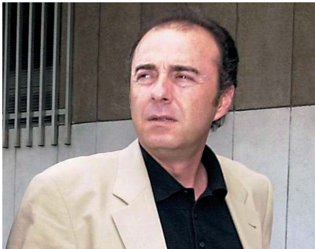
Miguel Zerolo, alcalde de Santa Cruz de Tenerife.

u otra forma en estas operaciones". En el mismo sentido, el escrito señala que en algunos de los documentos remitidos a Garzón "se destacan en recuadro con trazo distinto las personas que se vinculan a Coalición Canaria".