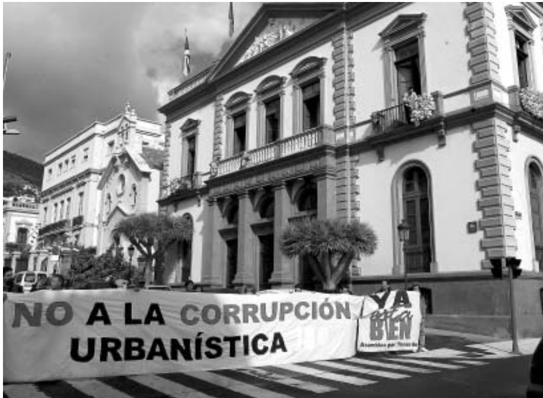
Arriba, una manifestación contra la corrupción ante el Ayuntamiento de Santa Cruz.