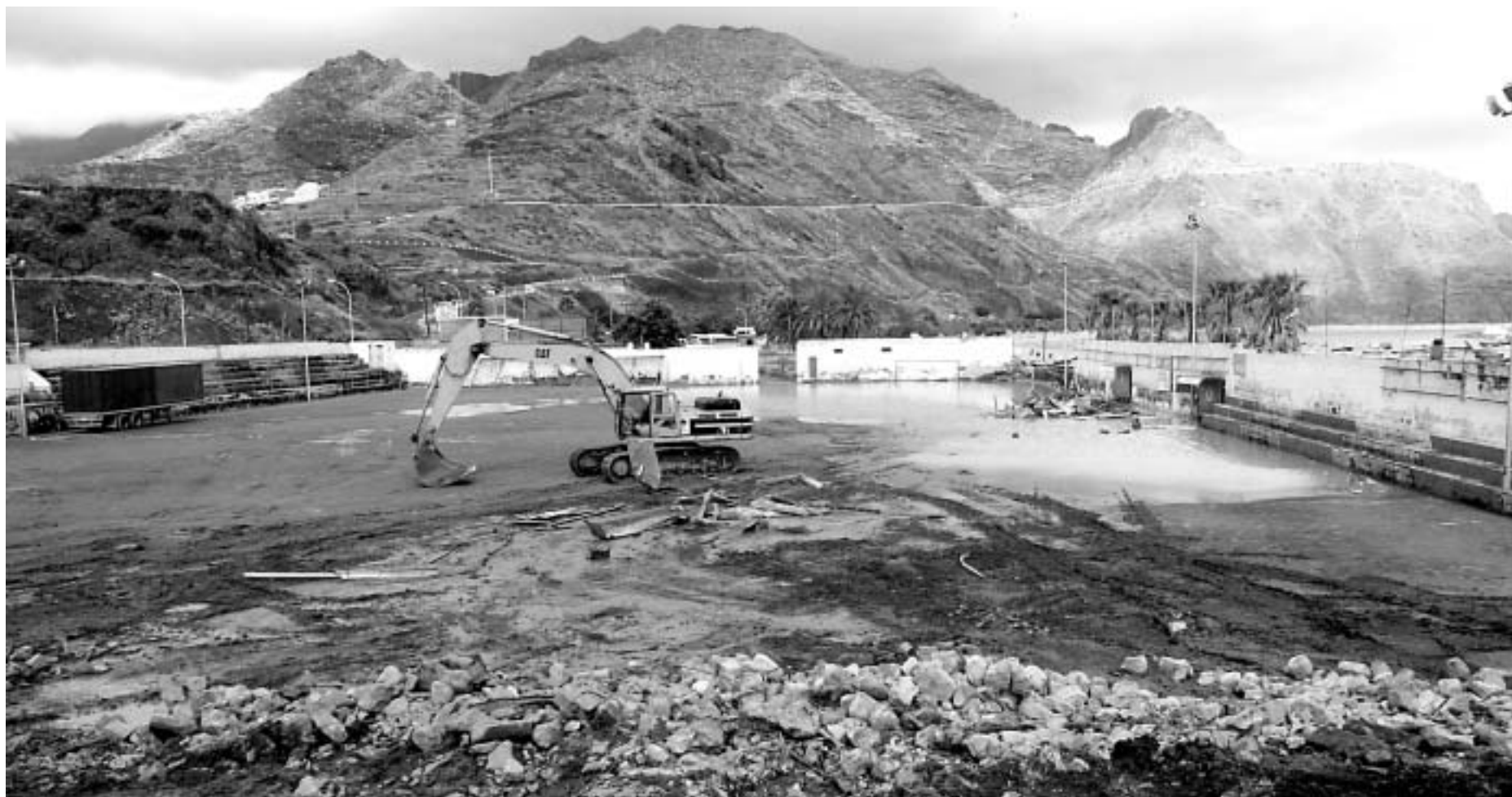
Trabajos en una zona deportiva en el barrio de San Andrés próxima a la playa de Las Teresitas, en Santa Cruz de Tenerife.