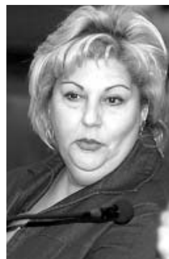
Pie de foto para | FOTOGRAFO