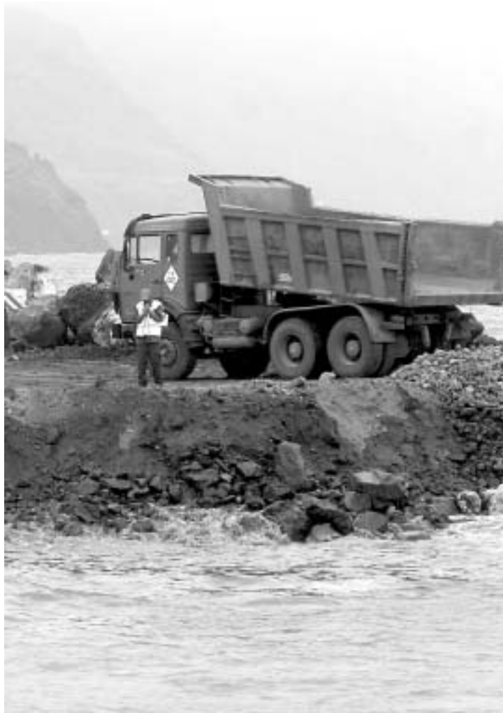
Imagen de las obras en el litoral tinerfeño de San Andrés.

Durante los más de cuatro años transcurridos entre la concesión y la adjudicación de la obra se produjeron denuncias de irregularidades en la tramitación del expediente, se ha